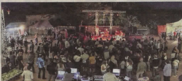
Devant Guembri Superstar, les spectateurs se sont croisés pour une dernière soirée de musique. Les lumières se sont éteintes dans l'émotion de toute l'équipe.